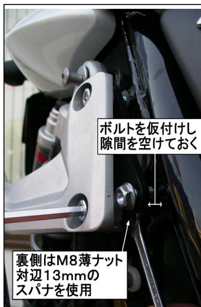
ボルトを仮付けし 隙間を空けておく