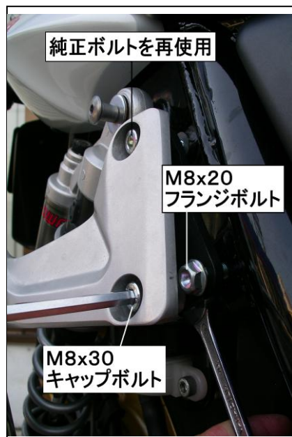
純正ボルトを再使用

付属のタンデムステップホルダーブラケットを取付けて、タンデムステップホルダーの取付け位置を変更します。右下側のボルト・ナットの締付けは、ナット側のスペースが狭いのでタンデムステップホルダーを浮かせた状態で先に締付けて下さい。