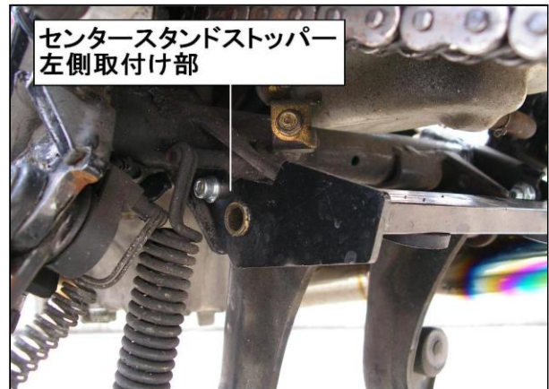
センタースタンドストッパー 左側取付け部