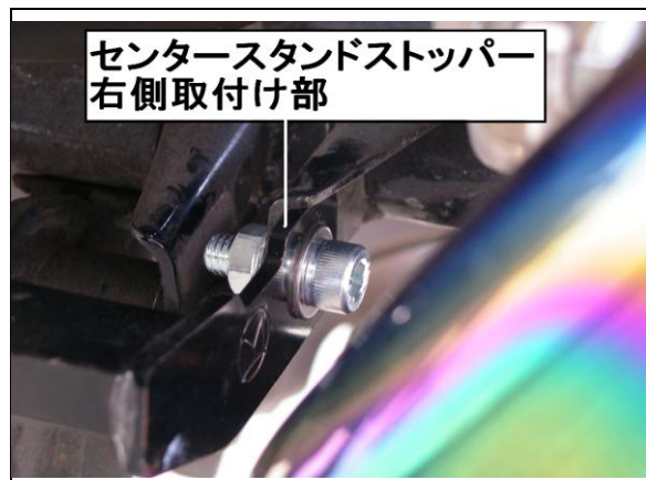
センタースタンドストッパー 右側取付け部