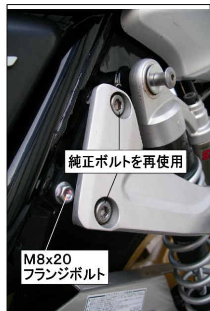
純正ボルトを再使用