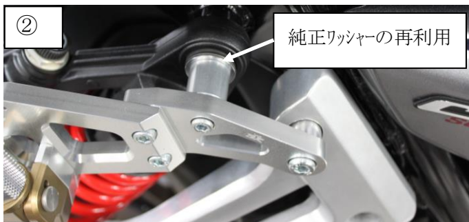
純正ワッシャーの再利用

タンDEMステップの上側ボルトを外します。 リアサス締め付けボルト(フレーム側)を外します。